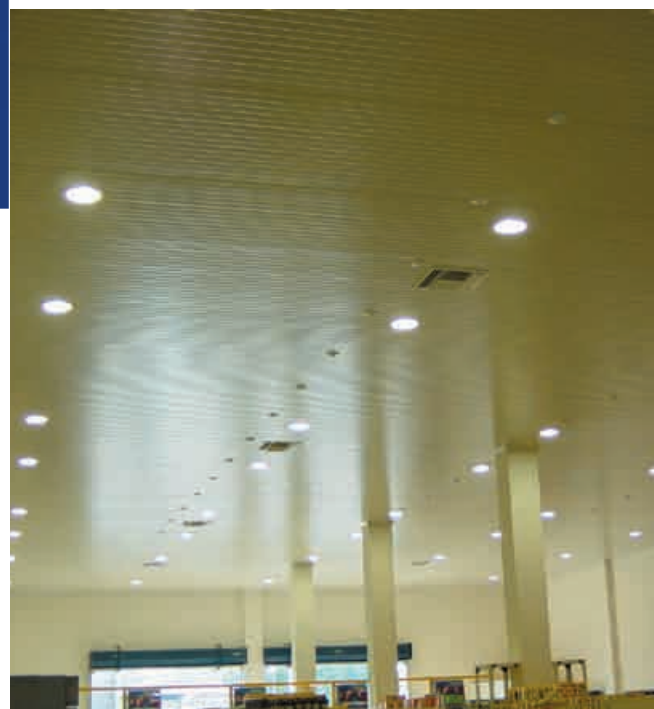
Cumple con la norma: NOM-008-ZOO-1994